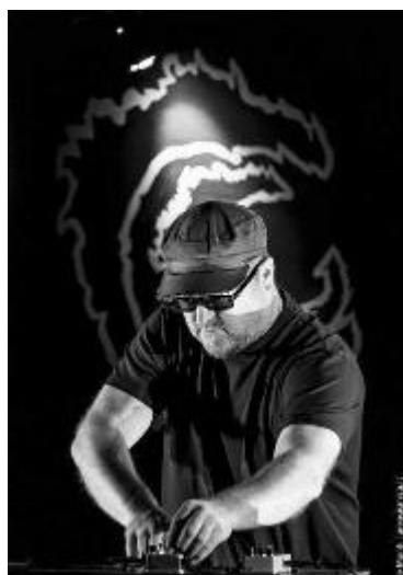
Thollem Mc Donas stasera al teatro del circolo Il Progresso

dei brani creati con le sue band. Ci sarà anche spazio per proporre dal vivo qualche anticipazione delle nuove brillanti canzoni che il musicista. Il risultato è un'avvolgente esperienza multimediale che abbina la performance solista di Thollem ai film e all'approccio visuale unico di Acvilla, che utilizza apparecchiature digitali con una mentalità analogica. Ingresso 10 euro riservato soci Arci/Uisp.